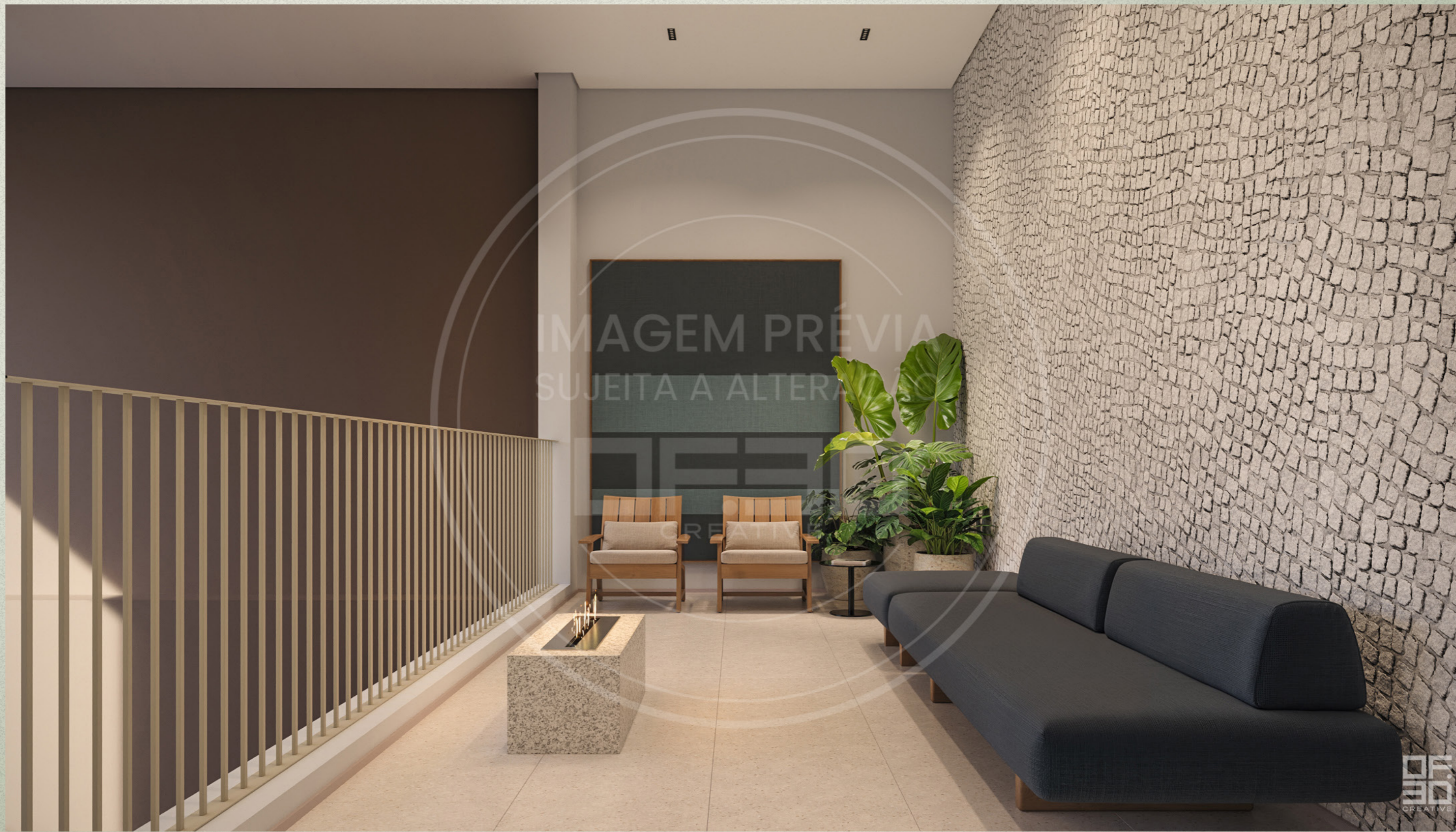
IMAGEM PRÉVIA SUJEITA A ALTERAÇÃO